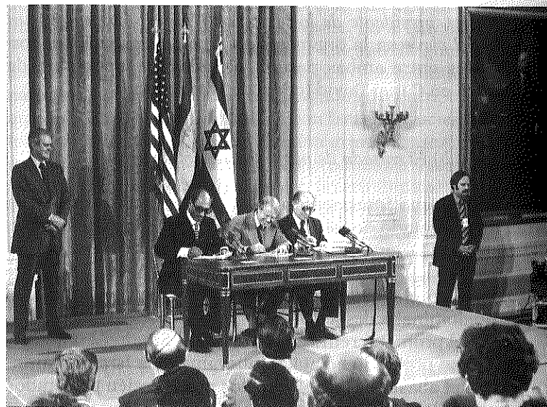
ILUSTRACIÓN XI.3. Egipto e Israel firman un tratado de paz (marzo de 1979): (izquierda a derecha) Anwar al-Sadat (Egipto), Jimmy Carter (Estados Unidos) y Menahem Begin (Israel), en la Casa Blanca

para que fuera posible firmar tratados similares entre Israel y Siria y Jordania. La opinión mundial empezó a ponerse en contra de Israel y a aceptar que el argumento de la OLP era válido, pero cuando los Estados Unidos intentaron reunir a la OLP e Israel en una conferencia internacional, los israelíes no cooperaron. En noviembre de 1980, Begin anunció que Israel nunca devolvería los Altos del Golán a Siria , ni siquiera a cambio de un tratado de paz, y que nunca permitiría que Cisjordania formara parte de un Estado palestino independiente , lo cual sería una amenaza mortal para la existencia de Israel. Al mismo tiempo, aumentó el resentimiento entre los árabes de Cisjordania respecto de la política israelí de establecer asentamientos judíos en tierras que eran propiedad de árabes. Muchos observadores temían que renaciera la violencia, a menos que el gobierno de Begin adoptara un enfoque más moderado.